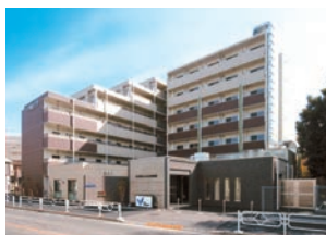
【取材したところ】 明治大学国際交流寮 狛江インターナショナルハウス